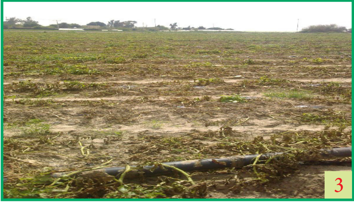
صورة (3) ذبول وموت النباتات المصابة بشكل كامل في الحقل (المراجع الصورة: مايسه مهيار).