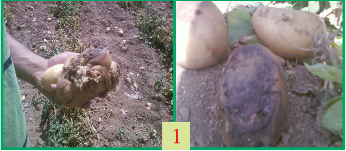
صورة (1) أعراض مرض العفن الطري على نباتات البطاطا في منطقة طواحين العدوان في محافظة الزرقاء.